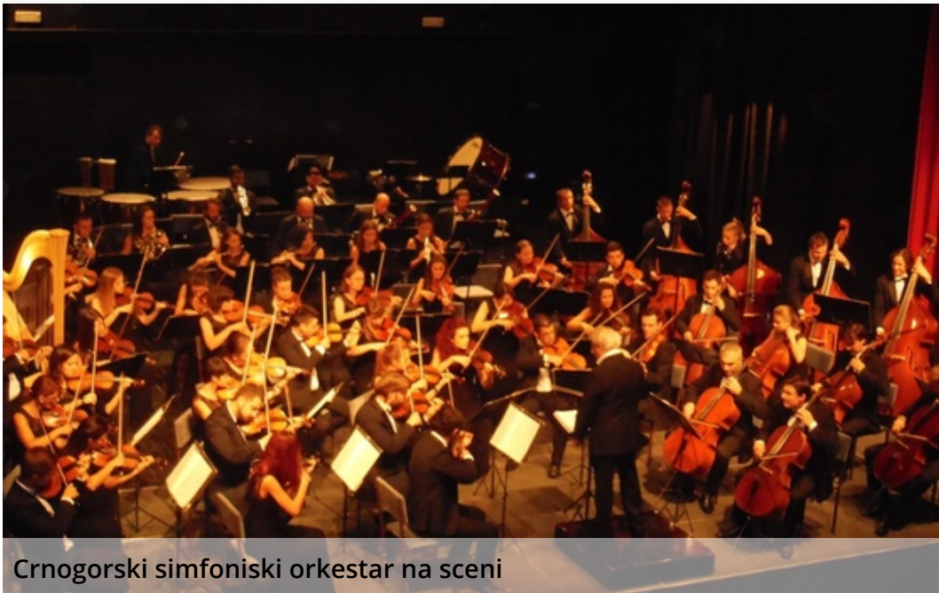
Crnogorski simfoniski orkestar na sceni